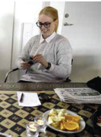
I værestedet Kraftcentrets lokale kan man komme forbi til fx familierådgivning – eller hygge.