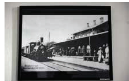
Bramming Banegård blev indviet for 142 år siden. Her ses den travle station i 1910. Fotoet hænger på væggen i Kraftcentrets og lokalrådets lokale.

i alt 30 tomme stationer primært i det jyske. Alle kommuner sagde ja tak, og der er nu planer i gang for 7 af stationerne.